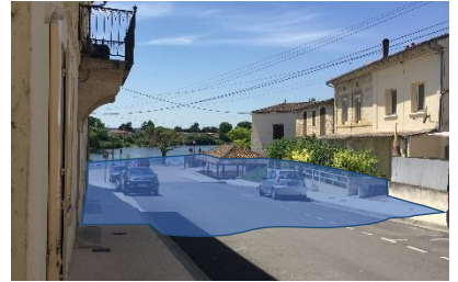
Représentation du niveau atteint par les eaux en 1944 (9,38m)

(6) : Déplacez-vous à présent vers la rive gauche et prenez à droite sur la D119. Entrez sur le parking du restaurant « La Plage » et rejoignez le bord de la Dordogne. Ancienne plage de Mouliets-et-Villemartin, cet endroit est depuis tout temps un lieu de loisir et de convivialité . Il permet également d'apprécier la façade fluviale de Castillon-la-Bataille sous un autre angle et de profiter du calme des bords de Dordogne. Avec cette prise de recul, précisez ce qui a pu retenir votre attention, un nouvel aspect du lien avec l'eau qui n'a pas été évoqué dans les autres lieux ou des propositions qui mettent en lumière le fleuve et ses environs.