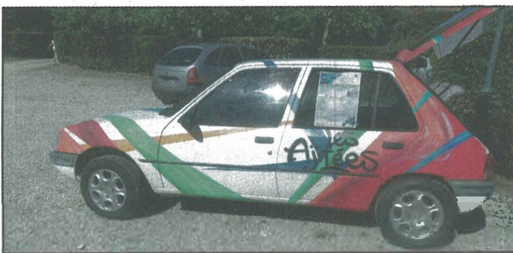
Une 205 bien équipée pour partir en raid humanitaire.