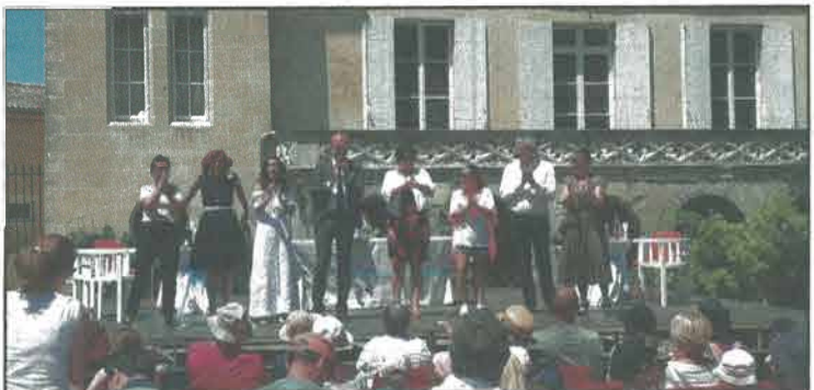
« Pour le meilleur et pour le pire ! » du théâtre Expression de Blanquefort.

diens, osez partager l'expérience théâtrale avec le nouveau metteur en scène professionnel, Philippe Mallet du théâtre JOB. La prochaine représentation du CEP « Les Brèves de Comptoir » aura lieu le