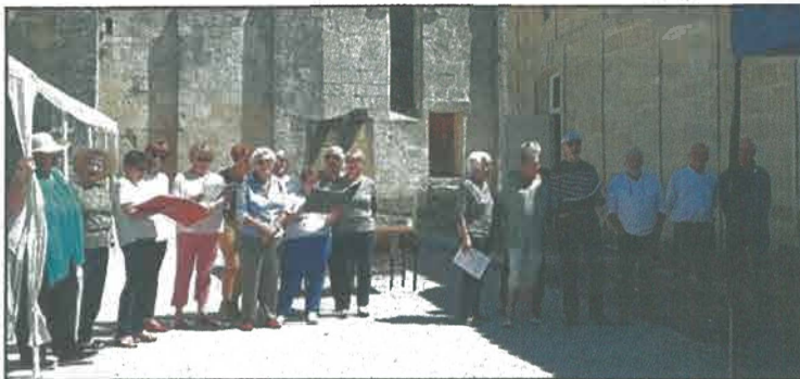
La chorale Tutti a fait un concert surprise.

regrettant cependant le peu de visiteurs qui ont fait le déplacement mais tous ont renouvelé leur souhait de revenir l'année prochaine.