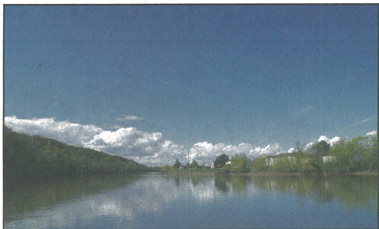
La Dordogne vue du pont de Branne.

Vendredi 28 juin à 16h deux macarons de la Réserve de biosphère Unesco seront posés de part et d'autre du pont de Branne. Afin de rappeler que la Dordogne est un trésor qu'il convient de préserver.