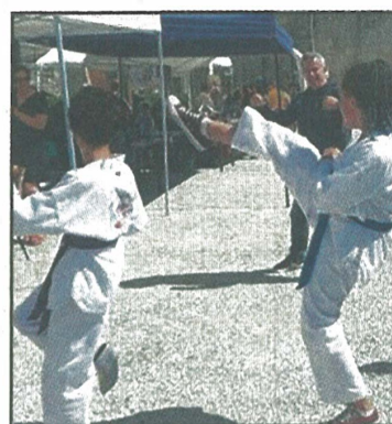
Démonstration de taëkwondo en cours.

Le sport était bien représenté (rugby, badminton, ping-pong, handball, gym, taëkwondo...) de même que les associations culturelles (danse sous toutes ses formes, AIAI informatique, chant...) ainsi que l'association Pocli dont l'objectif est de créer des liens entre les habitants pour des moments de partage et de rencontre. Jeun's Attitude (de Saint-Quentin) a présenté la voiture qui partira avec trois jeunes pour un voyage humanitaire dans le cadre du projet "Euro Raid". Après un mini concert surprise de la chorale Tutti de Branne, l'apéritif offert par le TAM fut le bienvenu. Tous les participants ont apprécié l'accueil qui leur a été réservé